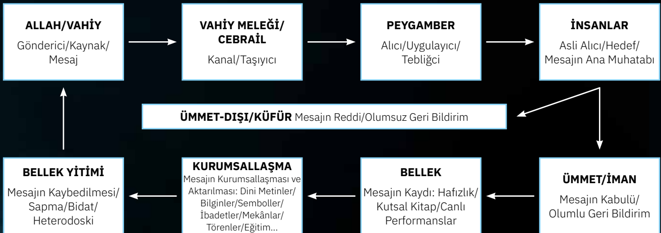
Şekil 1: Geleneksel Semavi Dinlerde İletişim Modeli

Geleneksel semavi dinlerdeki iletişim modeli, ilahi mesajın aşamalı olarak toplumsal hafızaya yerleştiği ve zamanla kurumsal bir yapıya dönüştüğü süreklilik içeren bir gelişim hattı oluşturur. Aşağıdaki şema, bu iletişim zincirinin nasıl yapılandığını kavramsal düzeyde özetlemektedir.