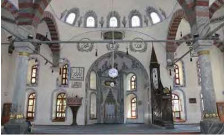
Kütahya Ulu Camii

Kütahya'nın tarih boyunca geçirdiği değişimleri gösteren kapsamlı bir kültür merkezi niteliğindedir.