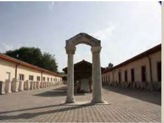
Anadolu Kültür Sanat ve Arkeoloji Müzesi

Kütahya'nın doğal ve tarihî güzelliklerini bir arada görmek isteyenler için etkileyici yerlerden biri de Frig Vadisi'dir. Kayalara oyulmuş anıtlar, eski tapınak kalıntıları ve geniş